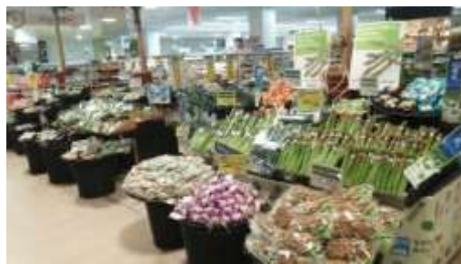
↑ 湘南モールフィル店 ↓