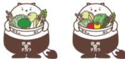
↓ 八王子みなみ野店 →