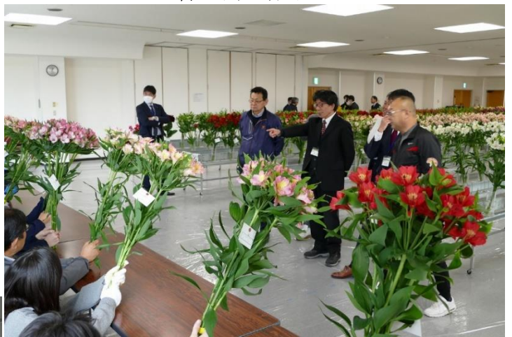
伊那東小学校花育の様子