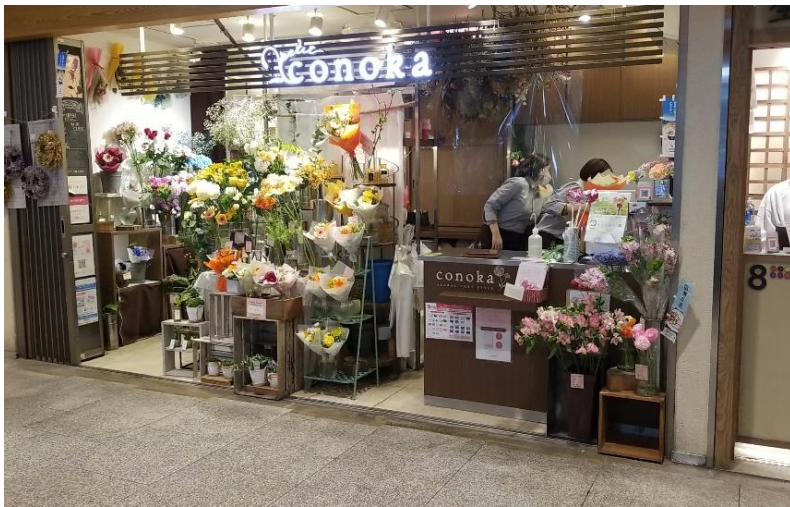
プチコノカの様子