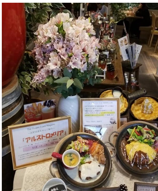
上高地あずさ珈琲の様子