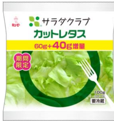
<今回発売する増量「カットレタス」> (100g/100円)