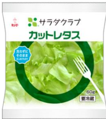
<通常の「カットレタス」> (60g/100円)