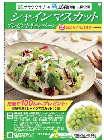
プレゼントキャンペーン 「応募はがき」